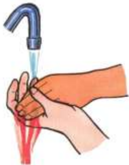
Промыть рану водой с мылом