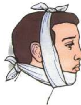
При переломе нижней челюсти наложить пращевидную повязку