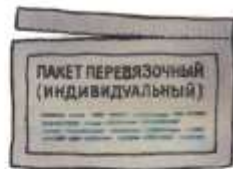
Вскрыть перевязочный пакет