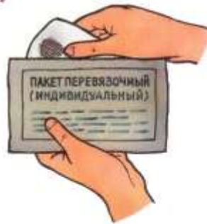
Извлечь повязку из чехла