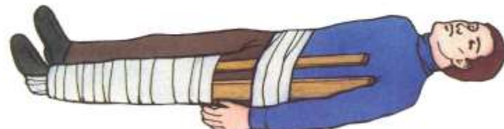
При переломе бедренной кости прибинтовать подручные средства