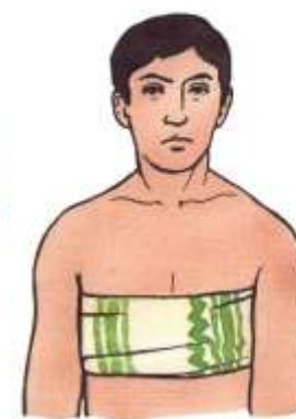
При переломе рёбер обмотать грудь полотенцем