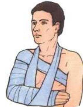
При переломе предплечья прибинтовать лестничную шину