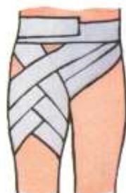
На паховую область