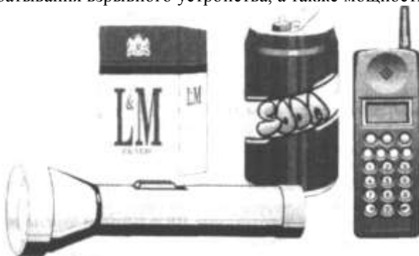
Рис. 2. Самодельные взрывоопасные предметы

Самодельные ВОП (рис. 2) отличаются огромным разнообразием типов взрывчатого вещества и предохранительно-исполнительных механизмов, формы, веса, радиуса поражения, порядка срабатывания и т.д. и т.п. Их особенностью является непредсказуемость прогнозирования момента и порядка срабатывания взрывного устройства, а также мощность взрыва.