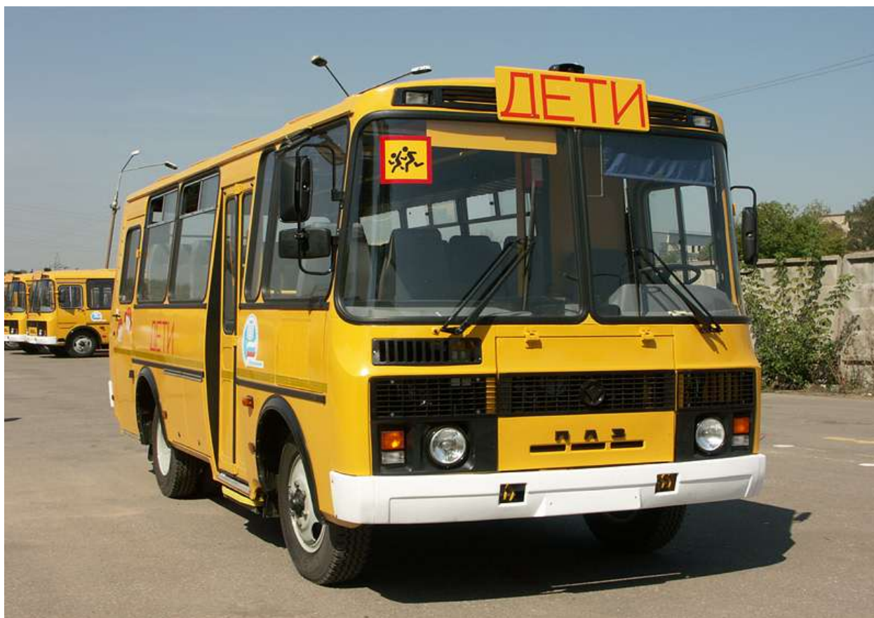
Образец вида специализированного транспортного средства